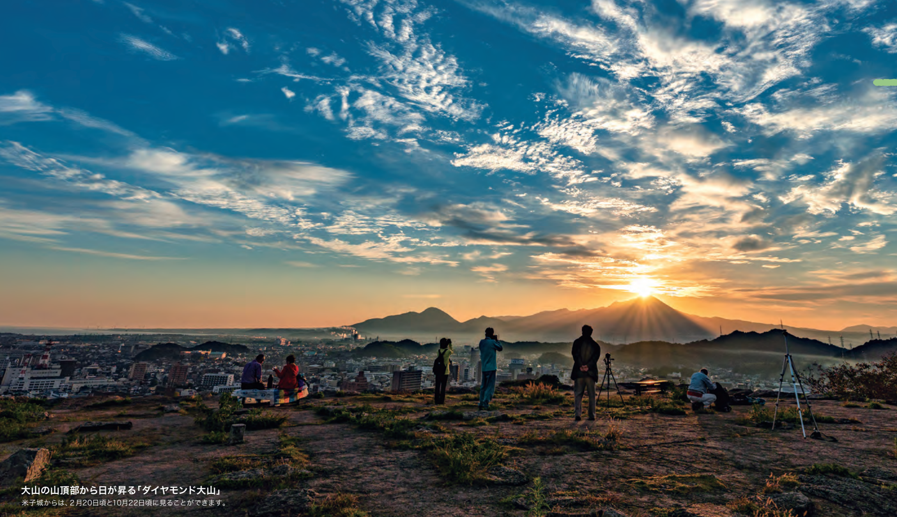
大山の山頂部から日が昇る「ダイヤモンド大山」 米子城からは、2月20日頃と10月22日頃に見ることができます。