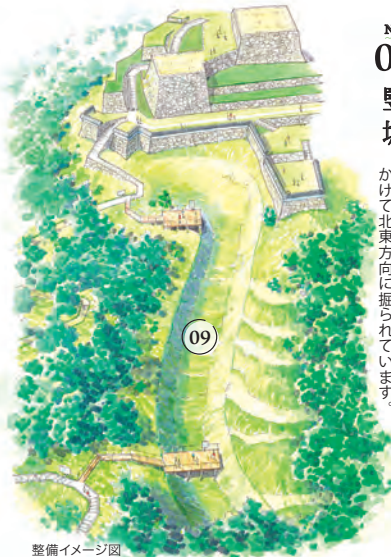
No.09 縦堀 たてぼり