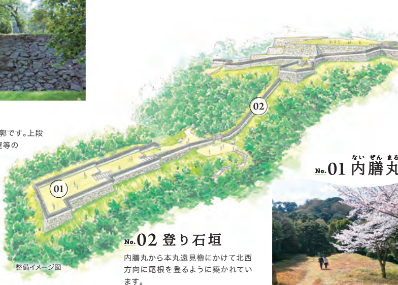
No.01 内膳丸 ないぜんまる