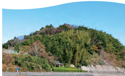
No.08 飯山(采女丸) いいのやま うねめまる

飯山に築かれた郭です。高石垣で囲われた三段の郭で、二段目は帯状に巡っていました。