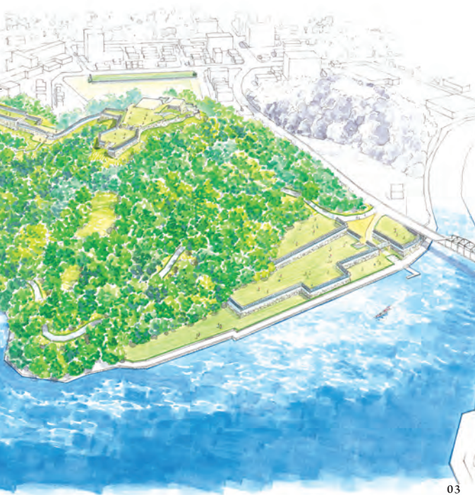
整備イメージ図 中海側

地の利を得た要塞 米子城が築城された時代は、戦国時代末期。戦が続く内のみならず、朝鮮出兵もあつたため、海外からも攻め込まれるかもしれない乱世の時代でした。それゆえに、防御力の高い城が求められました。 米子城は、まさに防御力の高い「鉄壁の城」で、地形を巧みに生かした、さまざまな防御施設があり、北東の「堅堀」、北西の「登り石垣」などで御殿のある二の丸や本丸を防御していました。